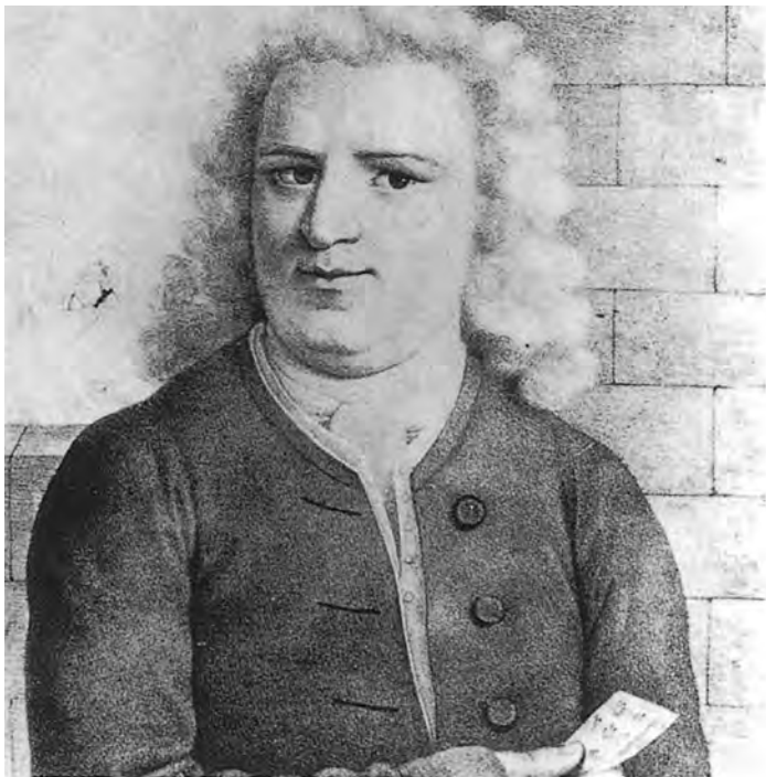
Johann Sebastian Bach, portrait c.1825