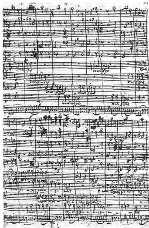
Mass in B minor, page from the autograph manuscript